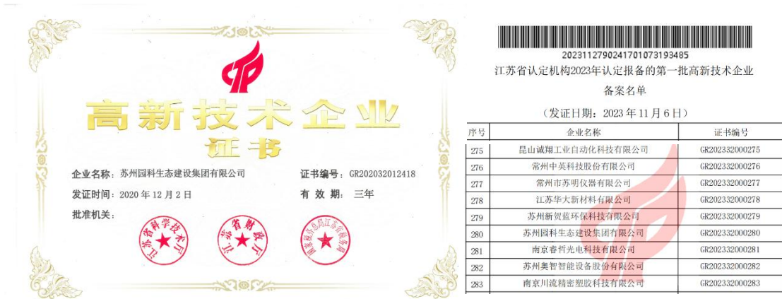
图 1 企业获第一批高新技术企业