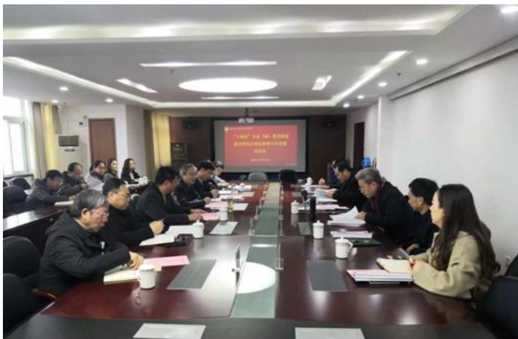
图 3 人才培养方案论证会

学生成绩包含生生互评、校内教师、企业导师三方测评，共同监测和改进人才培养过程。包括定期的技能评估、实习报告、导师反馈、学生满意度调查等，以便及时发现问题并改进。