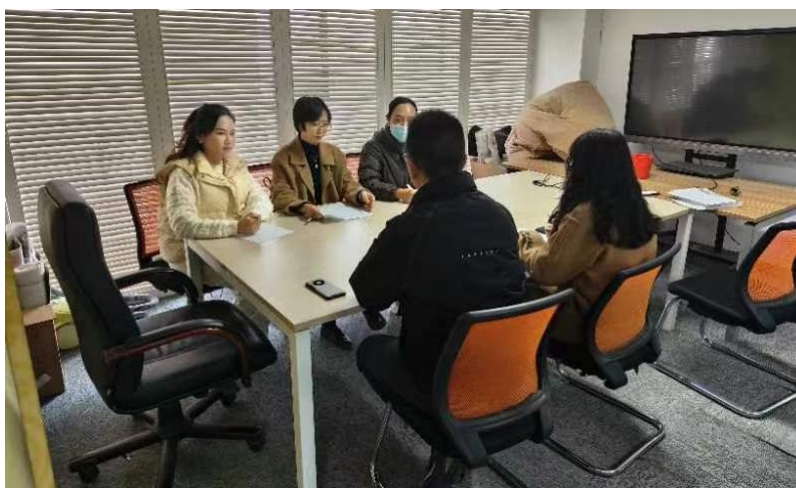
图 10 苏州园科生态建设集团有限公司所实训基地

苏州园科生态建设集团有限公司所作为园林景观设计校外实训基地，为学生提供大量的实习和实训的机会。在校外实训中，学生可以接触到真实的设计案例和职业环境，