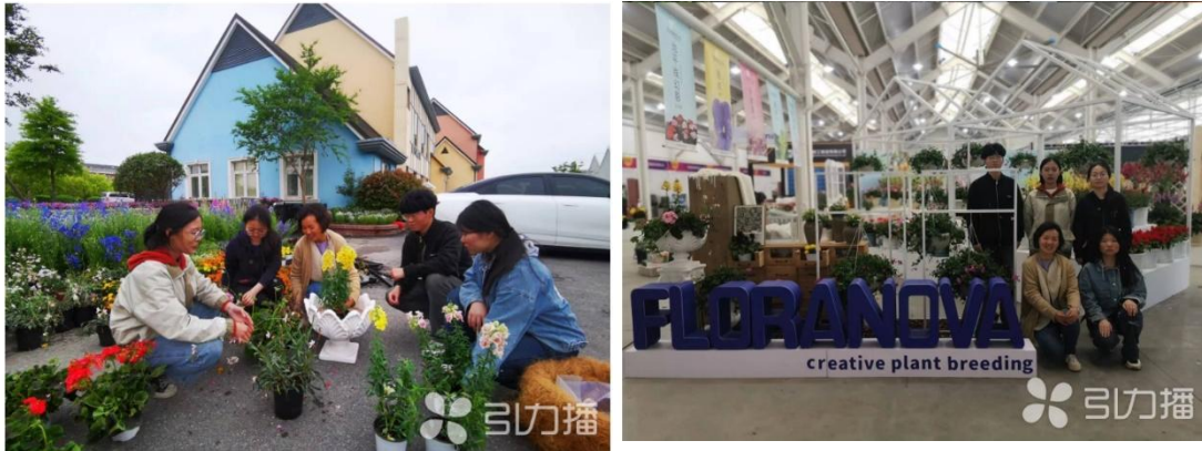
图 6 世界花园大会获最高奖“大金奖”（唯一）