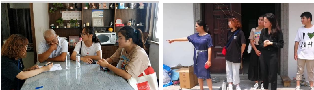
图 8 学生现场调研

学生通过校企合作项目，学生协助设计师工作，通过前期现场调研、中期方案设计、后期方案实施实现完整闭环教学。学生通过实际案例的完成可以更好地了解社会生活中的景观设计问题和实际需求，提高解决实际问题的能力和职业素养。