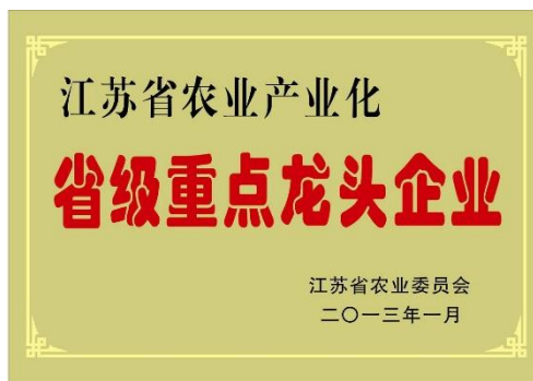
图 2 企业获省级重点龙头企业