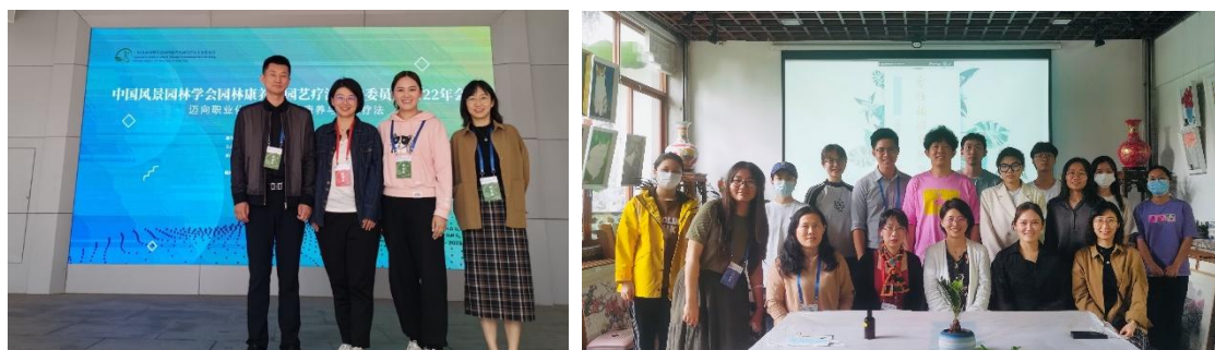
图 9 园林康养与园艺疗法团队活动

一是成立园林康养与园艺疗法研究中心。2022年7月，人力资源社会保障部向社会公示了新修订的《中华人民共和国职业分类大典》，其中新增森林园林康养师职业，预示着森林、园林等自然环境对于人类健康的促进效益得到了国家层面的认可，是行业发展的标志性里程碑。研究中心通过多种工作坊活动，推进园林康养与园艺疗法在教育研究、实践应用、推广普及等方面的全面发展。