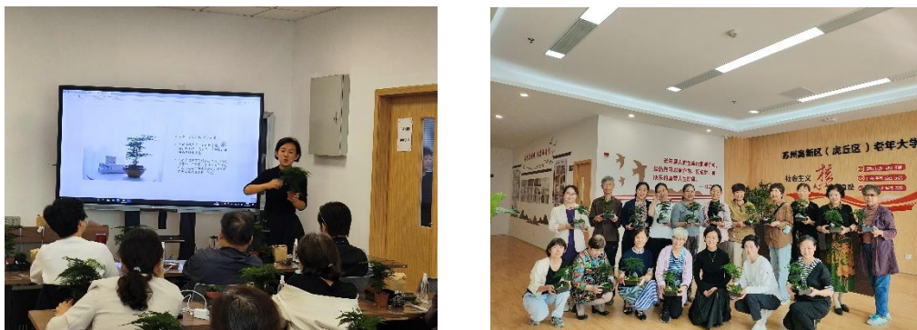
图 7 教师开展老年教育

在设计师和教师的带领下开展社区教育活动，在社区和老年大学内举办法治园林康养与园艺疗法活动，同时走出校园为有需要的人提供康养教育，帮助他人了解康养知识，提高康养意识。