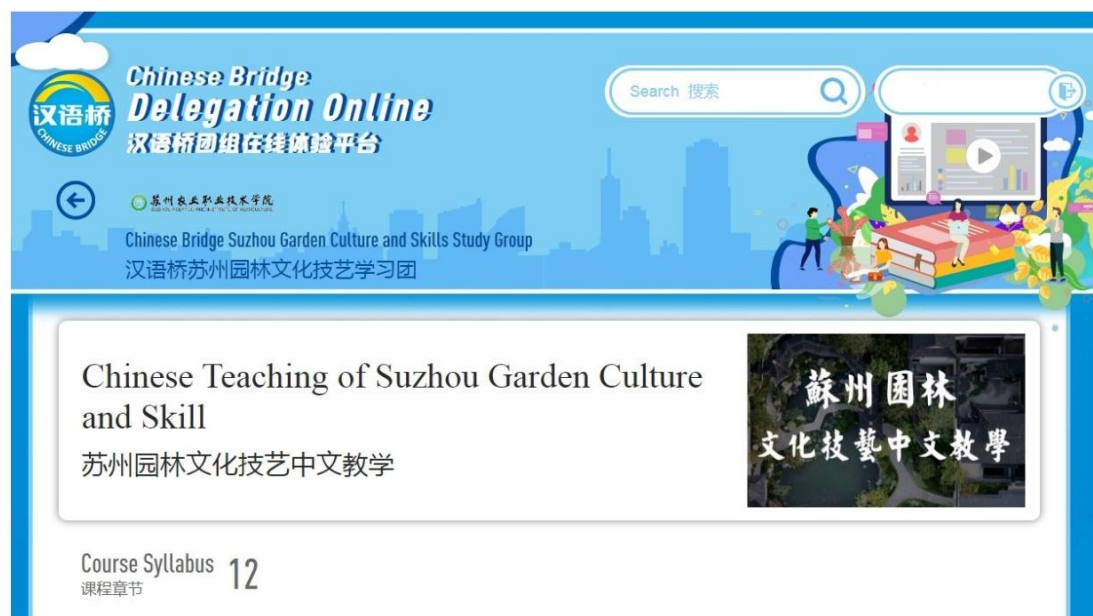
图 5 “汉语桥”资源平台

合作交流处副处长励莉，留学生办公室主任龚平以及园林工程学院教师代表和来自“一带一路”沿线 18 个国家的 113 名学员相聚云端，一同开启了苏州园林文化技艺的学习之旅。开幕式由项目负责人园林工程学院教师吉银翔主持。