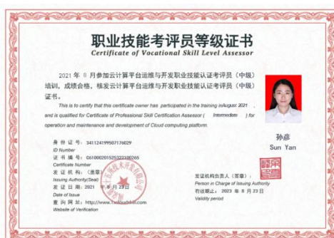
图 5 考评员培训证书