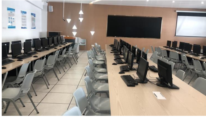
图 7 云计算平台运维与开发实训室