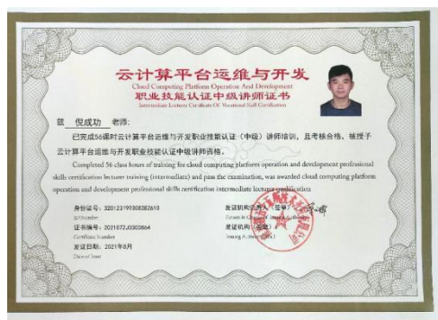
图 4 教师培训证书

为更好地培养高技能人才，计算机网络技术专业多位老师分批次参加了南京第五十五所技术开发有限公司组织的“云计算平台运维与开发”职业技能等级证书师资培训班。培训的核心内容包括“1+X 政策解读”、“标准解读”、“标准专业知识串讲”、“标准实训案例课程串讲”等。通过培训与考试，为更好的开展专业教学工作打下了坚实的基础。