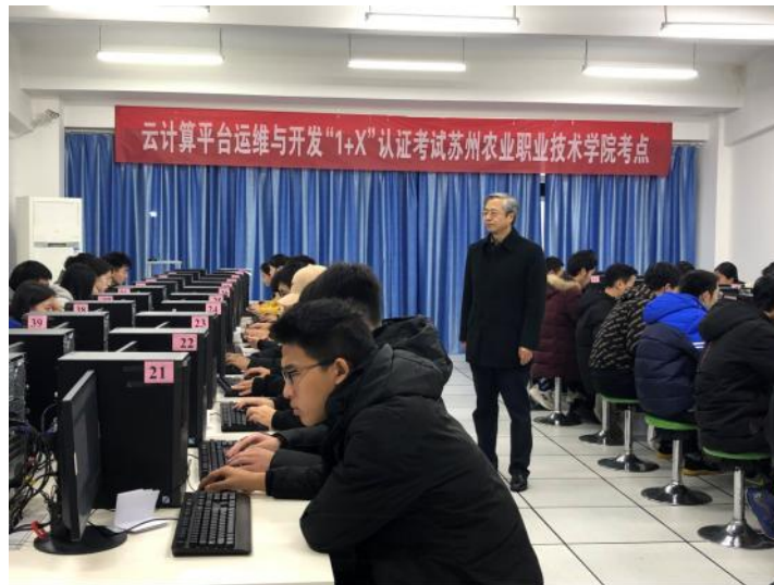
图 2 等级认证考试现场

计算机网络技术专业与南京第五十五所技术开发有限公司深入合作,以“1+X”证书制度试点工作为契机,全面推进专业建设。1+X”证书制度试点工作是《国家职业教育改革实施方案》重要改革部署,是一项重大制度创新,是深化“三教”改革、加快培养复合型技术技能人才的重要抓手。计算机网络技术专业与南京第五十五所技术开发有限公司按照教育部《关于推进 1+X 证书制度试点工作的指导意见》的要求,从专业建设、课程建设、教学资源建设、教学模式改革、教学评价改革、师资队伍建设、学分银行建设等方面积极探索与实践,为苏南区域经济社会发展提供高级技能型人才支撑。